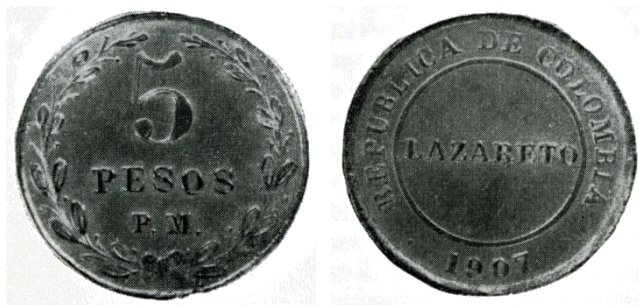
Afb. 7 5 pesos P.M. 1907

De nieuwe biljetten van 1, 2 en 5 pesos die in het Verenigd Koninkrijk gedrukt werden, versleten op veel kortere tijd dan deze van een hogere denominatie en om de oplevende economie niet te stremmen dienden met de regelmaat van de klok nieuwe edities van voormelde biljetten bijbesteld te worden. Op 18 oktober 1906 werd een decreet gepubliceerd waarvan artikel 6 stelde dat alle circulatiemunten die een denominatie uitgedrukt in centavos droegen, vanaf 1 februari 1907 ongeldig werden verklaard en dit zonder mogelijkheid tot inwisseling. Dit gold dus mutatis mutandis ook voor de ‘Lazaretos’ geslagen in 1901, hetgeen hun relatieve zeldzaamheid verklaart. Het Ministerie van Economische zaken ging er dus om kosten te besparen toe over circulatiemunten voor het algemeen publiek uit te geven met de denominaties van 1, 2 en 5 pesos voor een totale waarde die overeenkwam met de totale waarde van de biljetten van 1, 2 en 5 pesos die de regering in het Verenigd Koninkrijk had laten drukken en deze biljetten op die manier door koperen munten te vervangen. De door voormelde ongeldig verklaring verkregen enorme massa metaal werd vervolgens aangewend om de munten van 1, 2 en 5 pesos te slaan met na hun denominatie de specificatie P.M. (PAPEL MONEDA) wat papieren munt betekent.