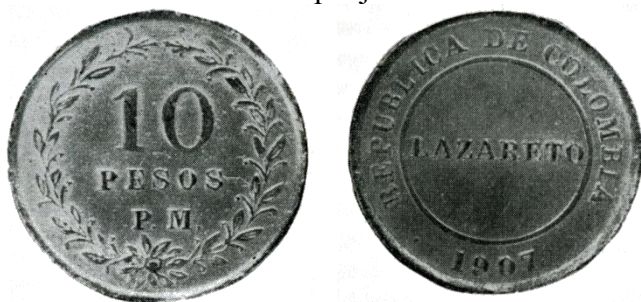
Afb. 8 10 pesos P.M. 1907

verboden was dat het metaalgeld bestemd voor de leprozenkolonies, buiten deze kolonies zou circuleren en dat als gevolg hiervan de autoriteiten verplicht waren dit soort van munten in beslag te nemen wanneer zij in het bezit waren van particulieren buiten voormelde instellingen. Tevens dienden alle nationale en departementale biljetten, afkomstig van de leprozenkolonies, aan het Ministerie van Economische Zaken te worden overgedragen om verbrand te worden en als zodanig vervangen te worden door nieuwe biljetten zoals bepaald door het Decreet 1263 van 8 oktober 1906. Voormelde operatie diende zo snel mogelijk te worden afgerond teneinde er voor te zorgen dat de belangen van de personen die in de leprozenkolonies verblijven geen nadeel zouden ondervinden. Deze munten werden geslagen in het munthuis van Bogota en waren het werk van de graveur Roberto Hinestrosa (initialen op muntstukken of ‘tokens’ R.H. of H.), een man die naast ontwerpen van munten tevens ontwerpen van enkele Colombiaanse ‘tokens’ op zijn actief heeft.