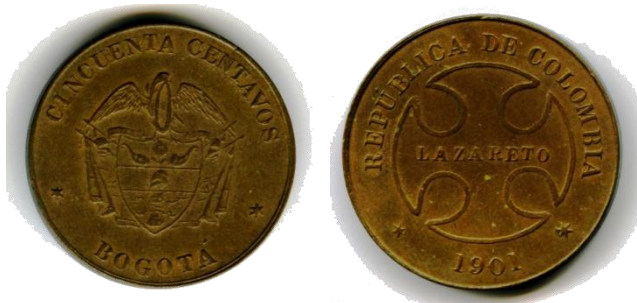
Afb. 5 50 centavos 1901

Het is echter wenselijk te vermelden dat op 17 oktober 1899, op de drempel van de 20ste eeuw, de ‘Guerra de Mil Dias’ (Oorlog van 1000 Dagen) was uitgebroken. Het was de zoveelste burgeroorlog in de geschiedenis van Colombia en deze duurde tot 21 november 1902, toen de strijdende partijen het verdrag van Wisconsin ondertekenden. Het land rolde zo de 20ste eeuw binnen met meer dan 200.000 doden en verminkten, het verlies van het departement Panama dat onder druk van de USA ‘onafhankelijk’ werd, een totaal ontwrichte economie en dito monetair stelsel door een massale instroom van waardeloos nationaal en departementaal papiergeld en een hollende inflatie.