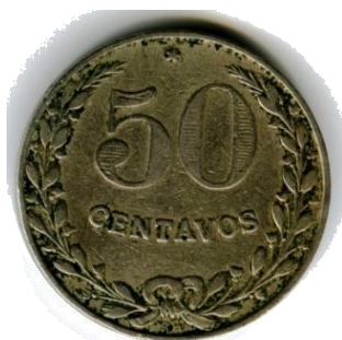
Afb.13 50 cent. 1921