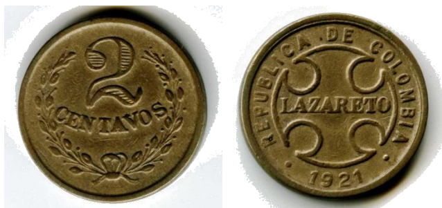
Afb. 10 2 centavos 1921

Decreet nr. 2909 uit 1918 (1, 2 en 5 centavos, aangemunt in 1921) en Decreet nr. 68 uit 1919 (10 centavos, aangemunt in 1921) maakten de weg vrij voor een derde uitgifte van munten uitsluitend bestemd voor de drie leprozenkolonies. Deze stukken zouden aangemunt worden volgens dezelfde legering als vorige uitgifte (25% nikkel en 75% koper). Echter, in geen enkele wettekst uit die periode is er sprake van een specifiek stuk van 50 centavos en nochtans werd dit stuk wel degelijk in 1921 aangemunt [Tabel 3 en afbeeldingen 9-13]. Hoewel deze reeks munten hetzelfde gewicht en dezelfde afmetingen diende te hebben dan de overeenstemmende normale circulatiemunten uit die periode, is dit duidelijk niet het geval met de diameter en het gewicht van de 10 centavos 'Lazareto' die aanzienlijk groter zijn dan bij de corresponderende zilveren circulatiemunt. Ook de 50 centavos 'Lazareto' heeft een veel te laag gewicht in vergelijking met de corresponderende zilveren munt. Deze reeks van vijf munten, allen met gladde rand, werd ook geslagen in het munthuis van Bogotá en was weerom het werk van de graveur Roberto Hinestrosa.