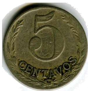
Afb.11 5 cent. 1921