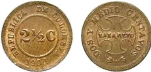
Afb. 1 2½ centavos 1901

Lepra, vroeger melaatsheid genoemd, is een alleen bij de mens bekende infectieziekte, veroorzaakt door de leprabacterie ( Mycobacterium leprae ). Deze werd ontdekt in 1873 door de Noorse arts G. H. A. Hansen, vandaar spreekt men ook vaak over de ziekte van Hansen, en is verwant aan de tuberculosebacterie. Lepra was reeds lang voor onze jaartelling bekend in India. Het oudste tastbare bewijs van lepra werd aangetroffen in enkele Egyptische mummies van zo'n 3500 jaar geleden. Ruim 2000 jaar geleden werd Zuid-Europa besmet en vandaar uit verder gans Europa. De ziekte bereikte er een hoogtepunt in de middeleeuwen en verdween daarna geleidelijk.