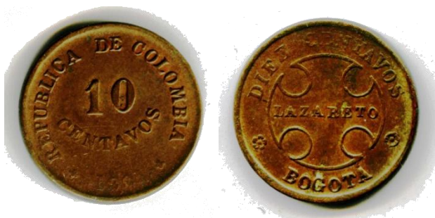
Afb. 3 10 centavos 1901

hetgeen men als ‘tokens’ zou kunnen beschouwen aangezien het hier wel degelijk gaat om muntgeld uitgegeven door een erkende overheid. Temeer daar deze operatie juridisch en politiek geruggensteund werd door wetgevende decreten.