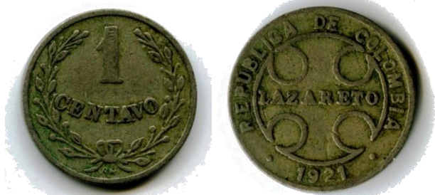
Afb. 9 1 centavo 1921

Vanaf december 1916, na de zoveelste munthervorming, werden de munten van 1, 2 en 5 pesos met P.M. na hun denominatie, zowel de 'Lazaretos' als de gewone circulatiemunten, gelijkgesteld met munten van respectievelijk 1, 2 en 5 centavos.