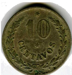
Afb.12 10 cent. 1921