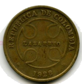
50 centavos 1928