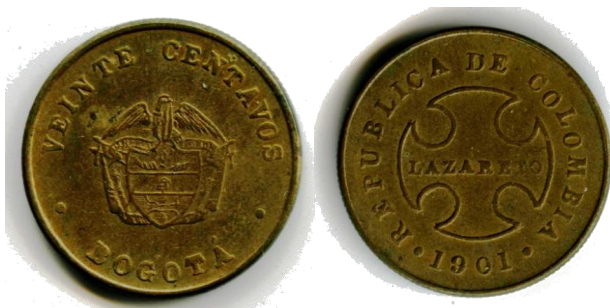
Afb. 4 20 centavos 1901

Gedurende de 20ste eeuw verrijkte Colombia de numismatiek met vier uitgiftes uitsluitend bestemd voor de drie leprozenkolonies. Vooraf is het misschien nuttig even aan te stippen dat, net zoals wat de overige muntuitgiften van Colombia uit de 20ste eeuw betreft, men reeds een vrij groot aantal varianten van deze munten heeft beschreven en dat, ondanks decennia lang ijverig speurwerk, er nog steeds nieuwe varianten aan het licht blijven komen.