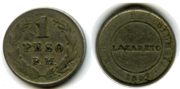
Afb. 6 1 peso P.M. 1907

is dat voor hun aanmuntning verschillende legeringen werden aangewend. Globaal gesproken kan men stellen dat de vervaardiging van deze stukken (vooral die van 5 en 10 centavos) vrij slordig is uitgevoerd. Nochtans, deze munten dienden wettelijk hetzelfde gewicht en afmetingen te hebben als de gewone circulatiemunten, die uit nikkel (2½ en 5 centavos) of uit zilver (10, 20 en 50 centavos) vervaardigd waren. De regering sloot om deze eerste uitgifte aan te munten een contract af met een aantal gespecialiseerde werknemers van het munt huis in Bogotá, dat in die periode gesloten was, en achtereenvolgens dienst deed als kazerne, school en drukkerij. Het muntstukje van 2½ centavos 1901 'Lazareto', waarvan tot op heden slechts enkele exemplaren bekend zijn, wordt terecht beschouwd als de meest zeldzame Colombiaanse munt van de 20ste eeuw. Het muntstuk van 50 centavos 1901 komt soms voor als een stuk dat niet geslagen is maar in een gietvorm gegoten. Het muntstuk van 50 centavos heeft een gladde rand, terwijl de vier overige stukken uit deze reeks een min of meer uitgesproken kartelrand hebben. Hoewel het hier om vervalsingen lijkt te gaan, zijn er verschillende numismaten die volhouden dat deze stukken authentiek zijn. Vanaf het moment dat de 'Lazaretos' in de leprozenkolonies opdoken, noemde het publiek ze 'coscojas' wat in het Spaans 'pocas cosas' wat weinig zaaks betekent, hetgeen mijns inziens ontzettend veelzeggend is.